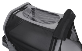
Safety Sleeper med vinyltak til kamera

Sengen kan tilpasses den enkeltes behov for tilgangspunkter (åpninger for slanger/ medisiner/sonde osv), takheis, innganger med mer.