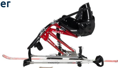
Praschberger Monoski egenkjørt