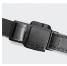
Fidlock magnetisk spenne