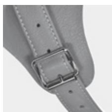
Thorn spenne forsterket